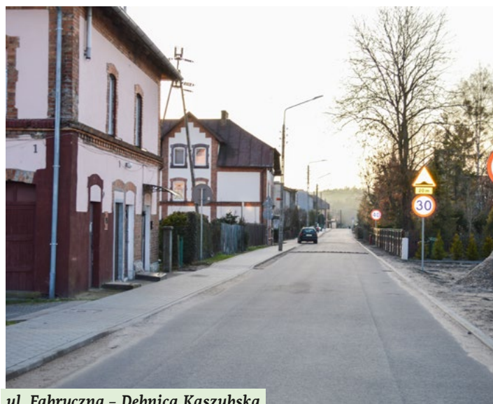
ul. Fabryczna – Dębica Kaszubska