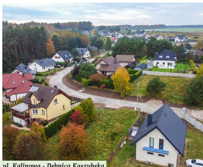
ul. Kalinowa - Dębica Kaszubska