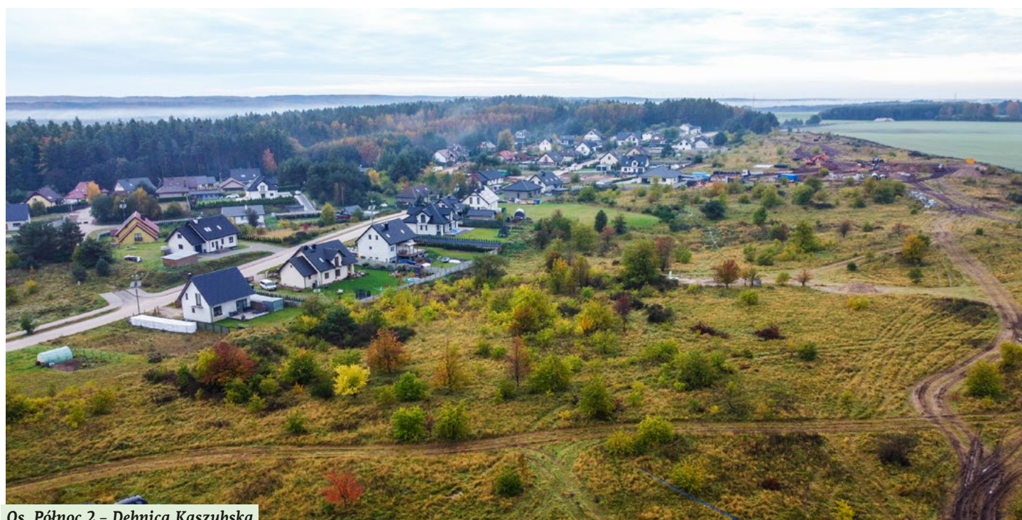
Os. Północ 2 - Dębica Kaszubska