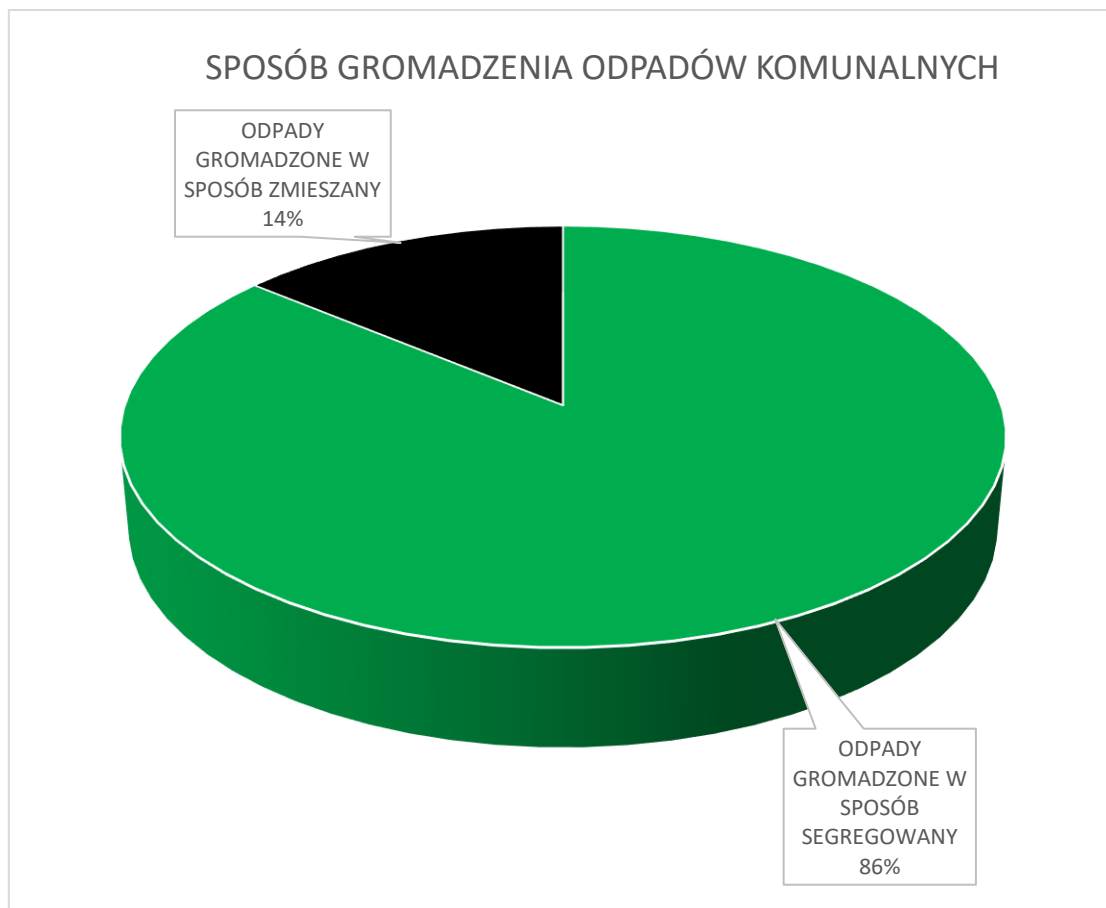
Rysunek 3: Sposób gromadzenia odpadów komunalnych z podziałem na odpady segregowane i zmieszane (źródło: dane własne).